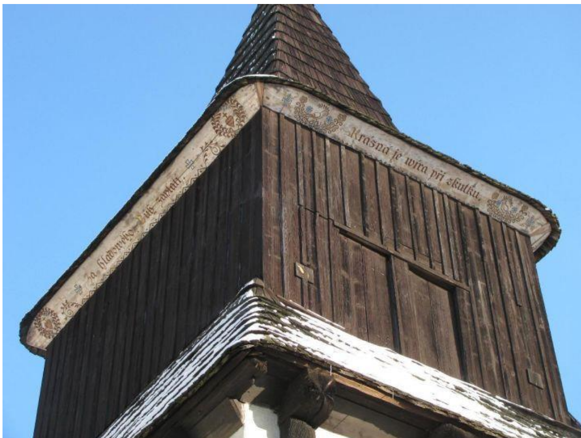
Výzdoba podhledů na zvonici v Korouhvi