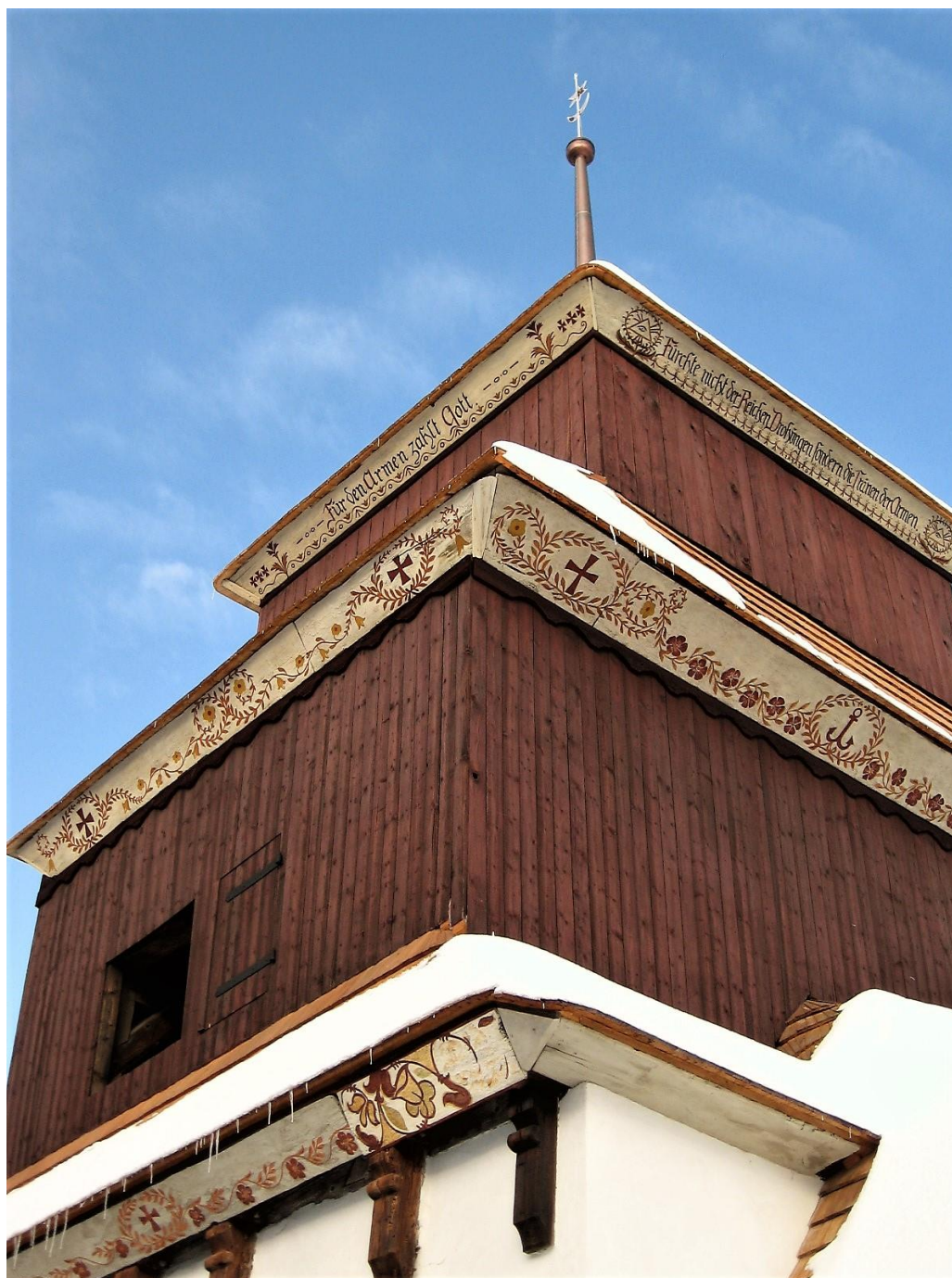
Výzdoba podhledů zvonice v Semaníně. Blíže k nápisům i ostatním motivům viz kapitola o zvonici.

Na zvonících v Semaníně i v Korouhvi jsou vymalovány podhledy šindelových stříšek velmi podobně. I mravoučné nápisy jsou podobné – u dvou nápisů se stejným významem, v jednom se kryje alespoň téma a pouze jeden nápis ze čtyř je zcela jiný. Shodné je zvláště schéma rozvržení nápisů a dekorů na prknech.